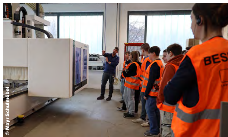
Die High-Tech-Anlage erweckte große Aufmerksamkeit.

Mayr Schulmöbel präsentierte sich bei der Initiative als attraktiver Arbeitgeber in der Region.