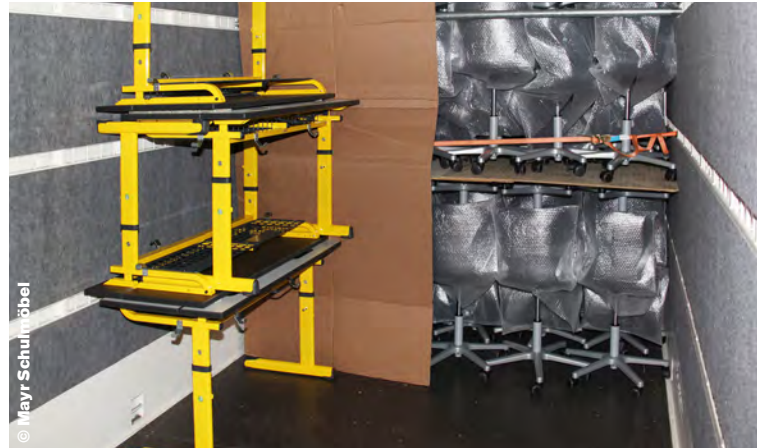
Mit Schaumstoff, Decken, Kartons und Co. wird die Lieferung bei der Zustellung geschützt.

Nachhaltigkeit liegt Mayr Schulmöbel sehr am Herzen. Dazu gehört auch umweltfreundliches Verpacken.